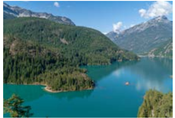
Diablo Lake, WA