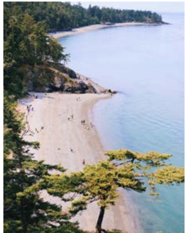
Deception Pass, WA