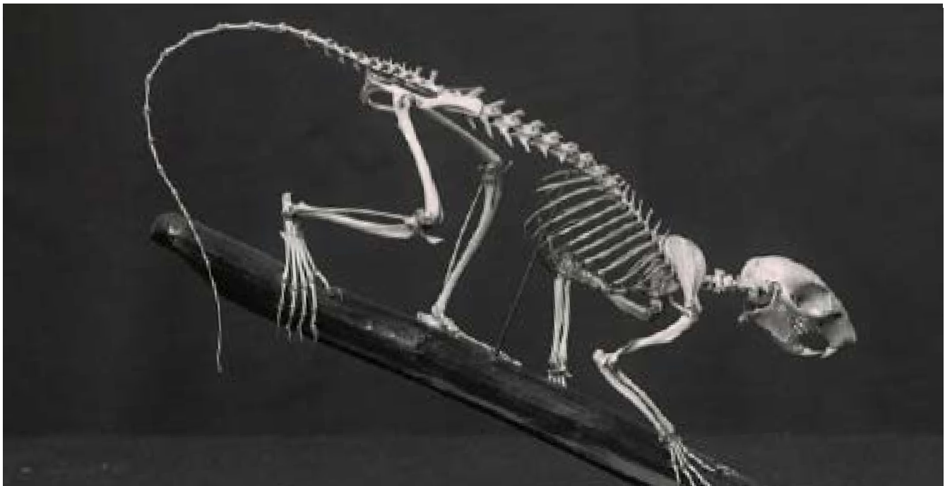
Smithsonian Institution Archives, Acc. 11-007, caja 019, n° de imagen MNH-4324

Los paleontólogos , los científicos que estudian a los animales prehistóricos, han descubierto la coloración de algunas especies de dinosaurios. Aunque no todos los fósiles de dinosaurios pueden decirnos de qué color era un dinosaurio, se ha encontrado que algunos fósiles contienen melanosomas , las estructuras microscópicas portadoras del pigmento que da el color a la piel, las plumas y el pelaje.