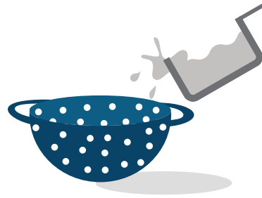
Verter la leche a través del colador en el fregadero