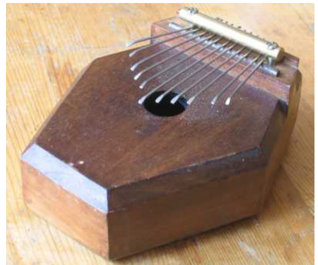
Una sanza.

Algunos lamelófonos están montados sobre una caja de resonancia. Una caja de resonancia es una caja hueca utilizada para amplificar, o aumentar el volumen de los instrumentos musicales. Los intérpretes tradicionales de mbira utilizan una calabaza partida por la mitad para amplificar el sonido. Para saber más sobre la historia cultural de la mbira y escuchar cómo suena, mira este vídeo: news.missouri.edu/2014/mbira-music 1 .