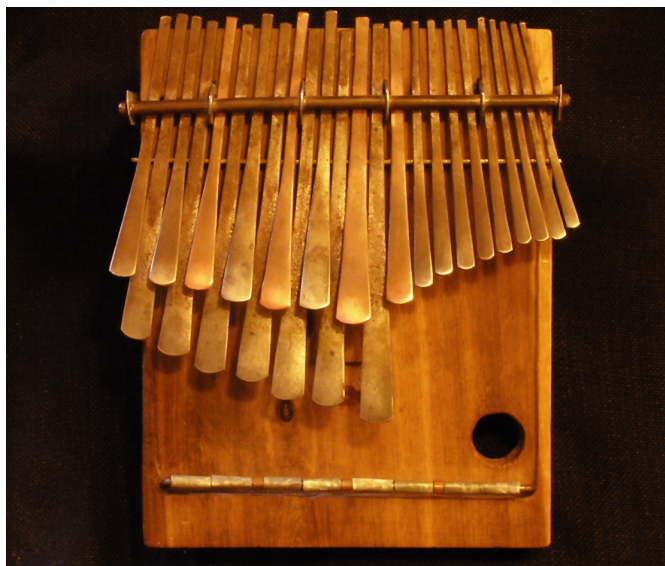
Un arpa fantasma de Zimbabwe